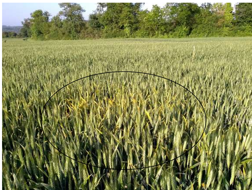
Foyer de rouille jaune en zone témoin

Période de risque : à partir d'épi 1 cm.