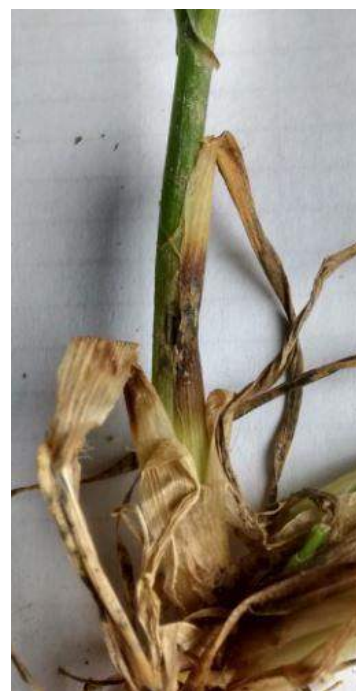
Symptômes de piétin-verse sur gaine

Aucun symptôme relevé cette semaine sur le réseau