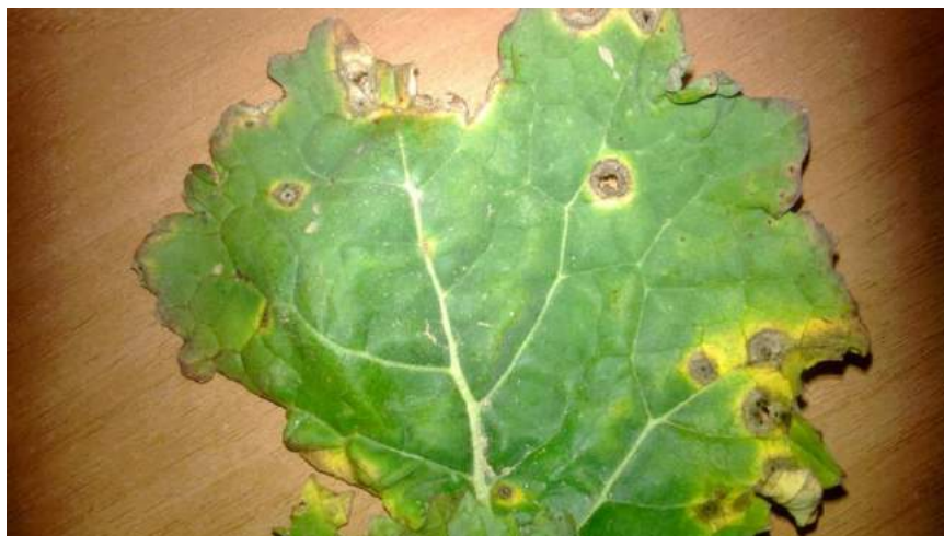
Symptômes de mycosphaerella sur colza

Les attaques peuvent être fréquentes en cas d'hiver doux et pluvieux.