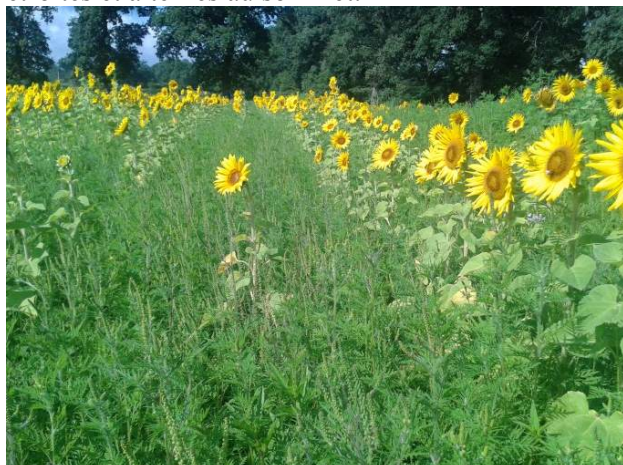
Parcelles de tournesol à Lussac les Eglises (87)

Selon les années, elle sort de terre entre fin mars et fin juin et se développe assez lentement jusqu'en juillet. Au stade adulte, la plante très ramifiée à la base, mesure de 30 à 120 cm avec un port dressé et peu dense. Elle a une tige velue qui devient rougeâtre en grandissant. Elle se reconnaît à ses feuilles de forme triangulaire très découpées et minces, d'un vert uniforme des deux côtés, larges et opposées à la base et plus étroites et alternes au sommet.