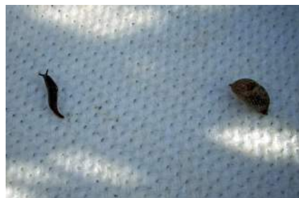
Capture de limaces en piège Inra-Bayer