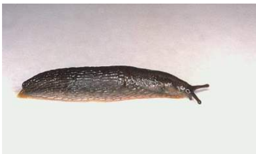
Limace noire adulte

Description : 30 à 40 mm de long, couleur bleu-noir, face ventrale jaune-orange ou blanchâtre. Bande latérale sombre sur chaque côté du corps. Bien qu'elle consomme les graines en germination, les cotylédons et les premières feuilles, elle s'attaque fréquemment aux racines, bulbes et rhizomes.