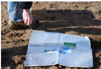
Mise en place du piège limaces Inra-Bayer

Cette méthode permet d'évaluer les niveaux de population à la parcelle et de se référer, le cas échéant, à un seuil de nuisibilité. Installer un piège au sol, de préférence en début de journée avant 10 h : une aquanappe Inra-Bayer 50 cm x 50 cm, un piège De Sangosse, Certis, ou à défaut, un abri (carton ondulé, tuile, soucoupe, planche...). Avant la pose, humidifier les pièges et éventuellement la surface du sol. Dénombrer les individus si possible le lendemain matin et à défaut au maximum 3 à 7 jours après selon les conditions climatiques. Les captures reflètent l'intensité de la population de limaces actives par m 2 .