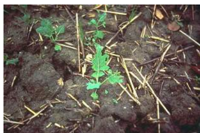
Dégâts de limaces sur colza

En général, les monocotylédones, notamment les céréales, sont moins sensibles que les dicotylédones aux morsures de limaces, grâce à leur capacité de compensation par tallage. Les grandes cultures les plus attaquées sont le colza, la betterave et le tournesol, particulièrement sensibles de la sortie des cotylédons jusqu'au stade 4-6 feuilles. Viennent ensuite les céréales à pailles, vulnérables pendant la germination (dès le gonflement de la graine) et jusqu'au stade 2-4 feuilles, le maïs, puis les cultures fourragères. Contrairement aux céréales qui, attaquées au niveau des gaines foliaires, continuent à croître, la plantule de tournesol flétrit et meurt lorsque l'hypocotyle est coupé. Sur les plantes âgées, la lacération ou la destruction des limbes est moins dangereuse et les pertes rarement dommageables. En revanche, les attaques sur pommes de terre (feuillage et tubercules) peuvent être localement préoccupantes.