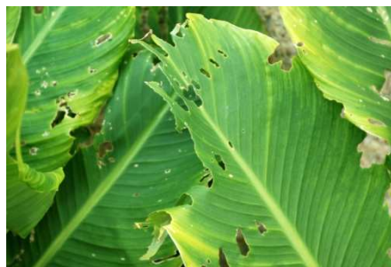
Morsures foliaires de limace sur canna