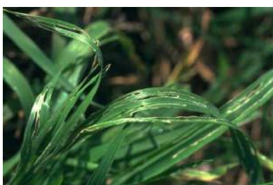
Morsures sur blé au printemps