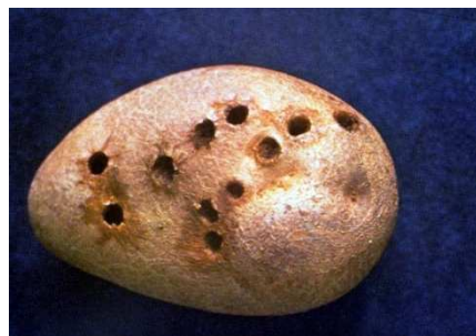
Dégâts de limace sur pomme de terre