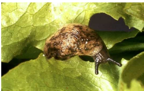
Limace grise adulte sur feuille de laitue

Description : 40 à 60 mm de long, couleur variant du beige au brun, mouchetée de fines taches sombres. Cette limace dévore les graines germées, les cotylédons, les plantules, les premières feuilles, mais aussi les cadavres d'animaux et les déchets verts.